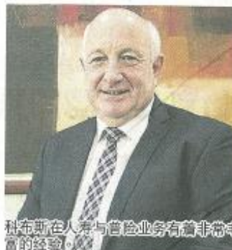
科布斯在人事與營險業務有著非常豐富的經驗。